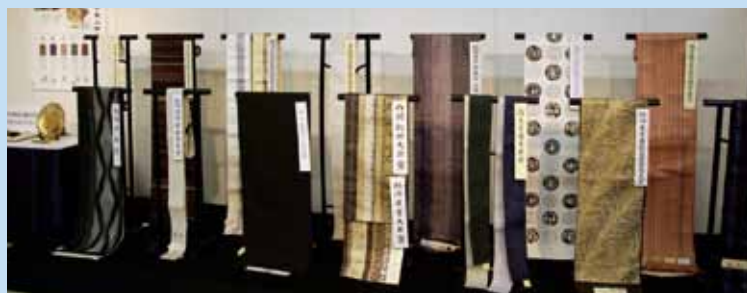
第59回博多織新作展入賞帯の展示